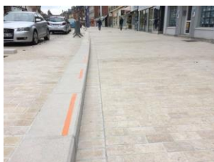
Figure 4. Surface artificialisée claire