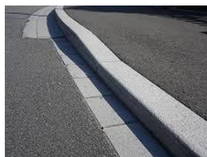
Figure 5. Surface artificialisée foncée