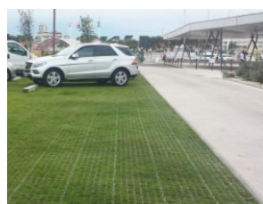
Figure 6. Surface artificialisée semi-imperméabilisée (parking pavés enherbés)